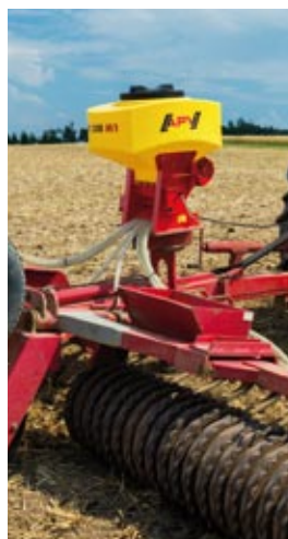
PS 200 mit Walze

Mit einer Vielzahl von verschiedenen Säwellen kann die Anpassung an die Saatgutkörnung vorgenommen werden.