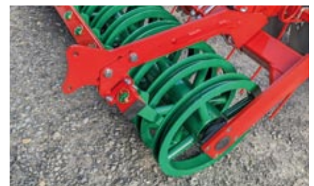
U-Walze 600 mm