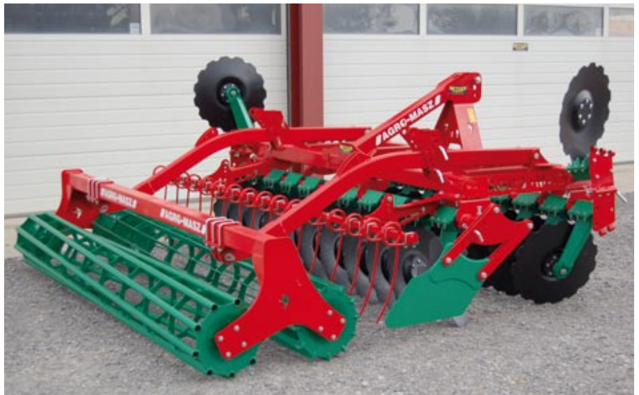
BT 30 (P-Scheibe) mit Doppelwalze und Striegel