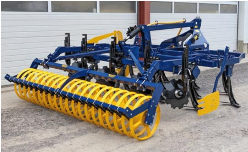
MG 300 Plus mit Dachwalze

Der 3-balkige Mulchgrubber MG 300 Plus mit 11 Zinken (System Köckerling) und hydraulischer Tiefenführung ist eine Weiterentwicklung des MG 300.