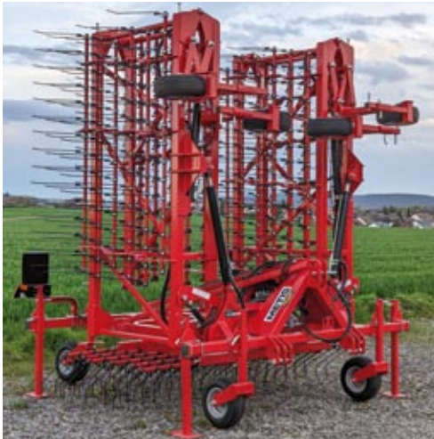
Metis 12 m