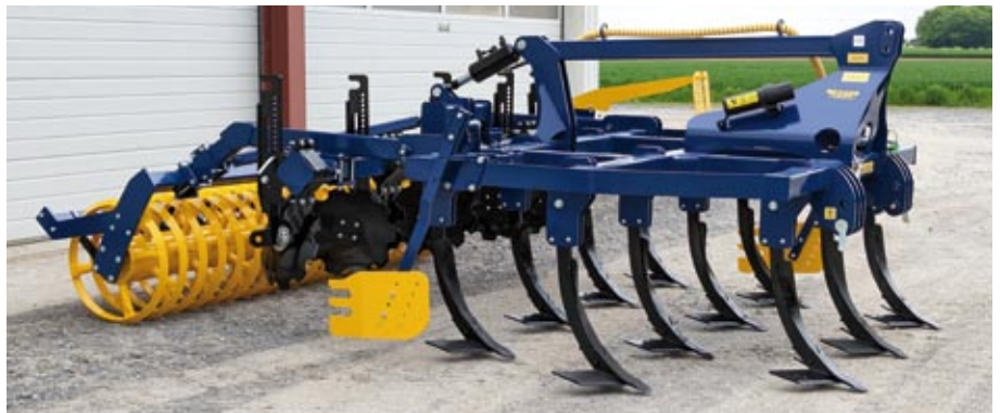
11 Zinken mit Flügelscharen 340 mm, Randblech