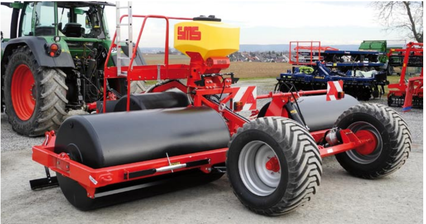
Golem 540 mit Sätechnik, Druckluftbremse und Bereifung 550/45-22,5