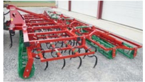
Saatbeetkombi 5,6 m