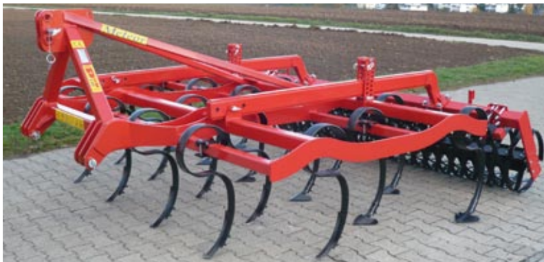
Meteor 3,0 m, Zinken 70 x 12 und Federwalze