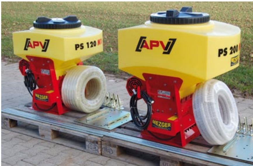
PS 120 und PS 200

Breites Einsatzgebiet z.B. Getreide, Mais, Körnerleguminosen, Kürbis, Sonnenblume, Schnittlauch, Bohnen, Erbsen, Sonnenblumen:..