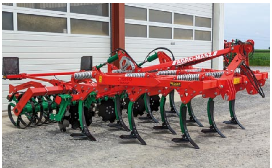
Runner 3 m mit Federsicherung und Federwalze