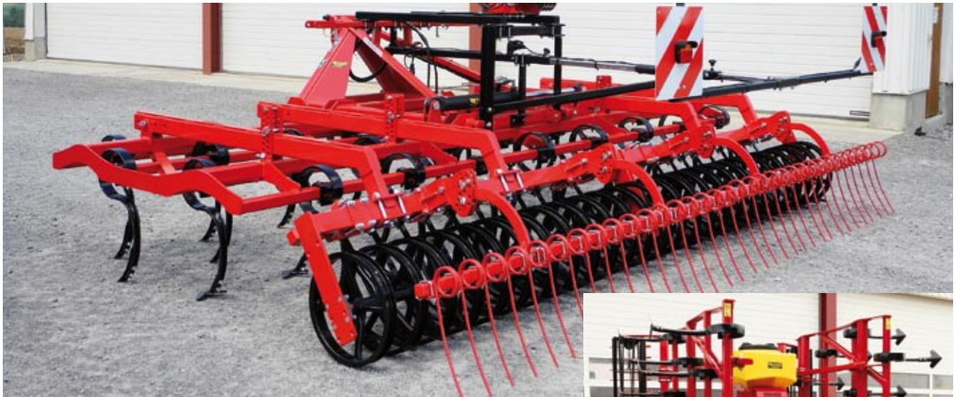
Meteor II 5,0 m, Zinken 70 x 12, U-Ringwalze, Striegel und LED - Beleuchtung