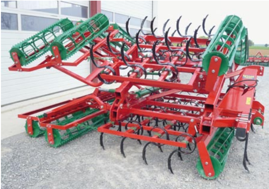
Saatbeetkombi 5,6 m