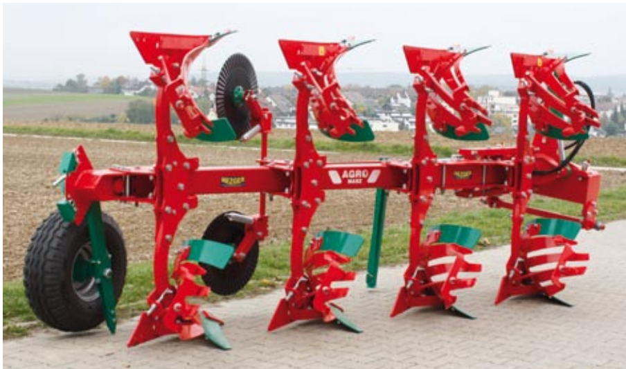
PO 4 - 85 mit Streifenkörper und Stroheinlegebleche