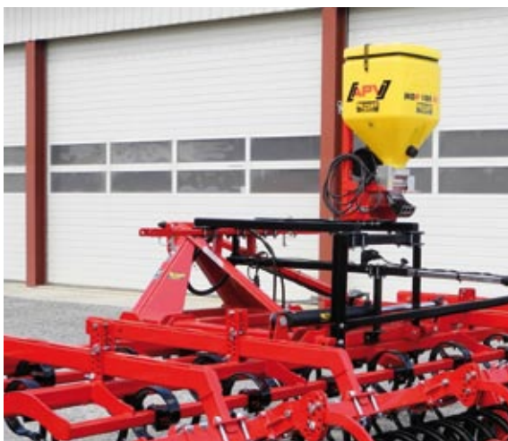
MDP 100 mit POM Meteor II

Exakte Querverteilung über die gesamte Arbeitsbreite. Abhängig vom Einsatz stehen verschiedene Steuerungen incl. ISO-BUS zur Verfügung.