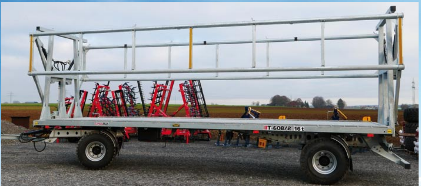
CYNKOMET Ballenwagen 16 t mit hydraulischer Ladungssicherung

Druckfehler, Irrtümer und technische Änderungen vorbehalten.