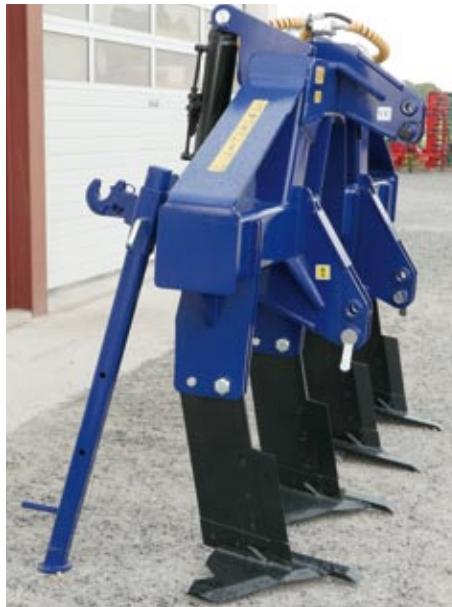
Tiefenlockerer TL 300-4