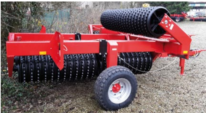
Teran 7,0 m mit Cambridgeringen

Acker- und Grünlandwalze 3-teilig, stabiles Fahrgestell, Zugöse 40 mm, Bereifung 10.0/75 15,3, Transportbreite unter 2,50 m, zum Klappen ist ein DW Steuergerät erforderlich. Beleuchtung gegen Aufpreis lieferbar.