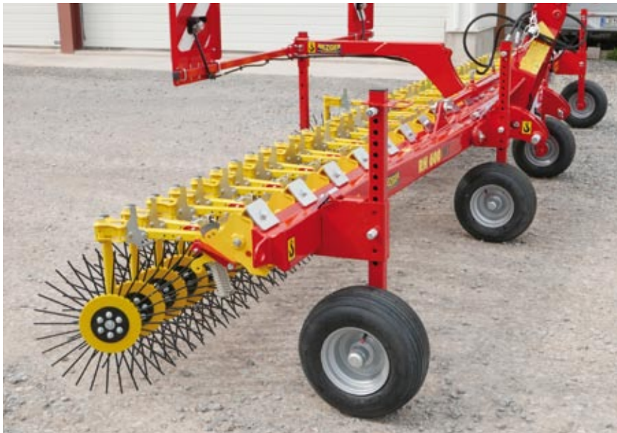
Rollhacke RH 600