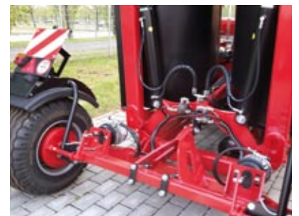
Fahrwerk mit Druckluftbremse