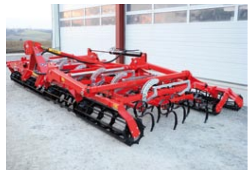
Die Arbeitstiefe wird über das Eggenfeld eingestellt.