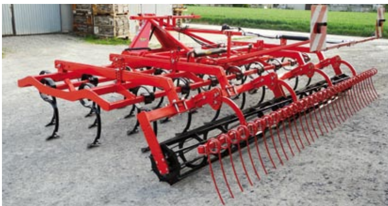
Meteor II 5,0 m, Zinken 70 x 12 und Stabwalze