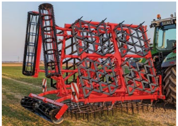
AD 67 mit Doppellegge und Stabwalze

Die Ackeregge eignet sich zum Abeggen von gepflügten oder gegrubberten Feldern. Durch die langen Zinken von 200 mm kann die Egge auch bei geringen Mengen von Ernterückständen eingesetzt werden. Durch den geringen Zugkraftbedarf ist eine hohe Flächenleistung auch mit kleineren Traktoren und geringem Kraftstoffverbrauch möglich. Durch den Einsatz einer Egge erwärmt sich der Boden im zeitigen Frühjahr deutlich besser. Gleichzeitig wird mit dem Eggeinsatz auch eine erste Unkrautbekämpfung erreicht. Die Maschine ist mit einem extra starken Rahmen ausgestattet. Transportbreite: 2,95 m