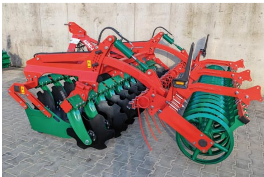
BT 30 (C-Scheibe) mit Dachwalze, Striegel, Randblech und Randscheibe, Beleuchtung