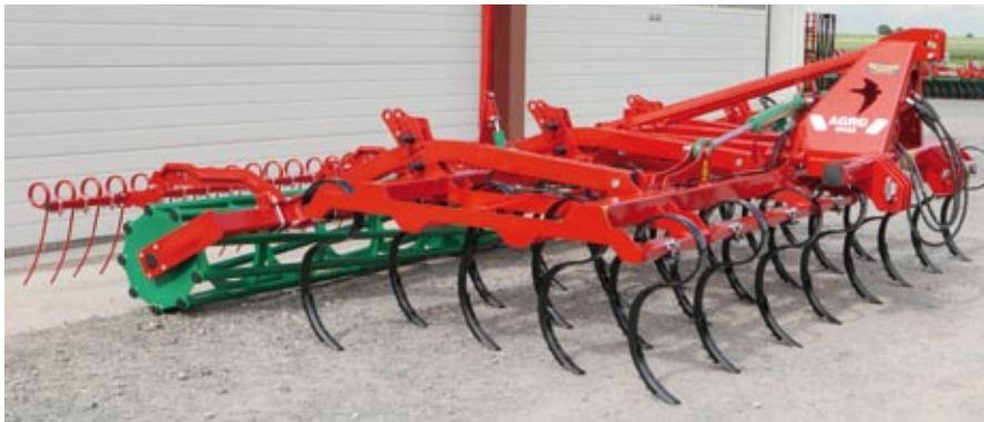
APS 5,0 m mit Schmalscharen, Rohrwalze und Strohstriegel