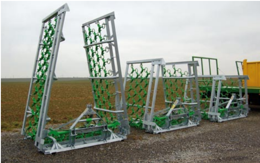
Wiesenschleppe 8,0 m; 6,0 m; 5,0 m