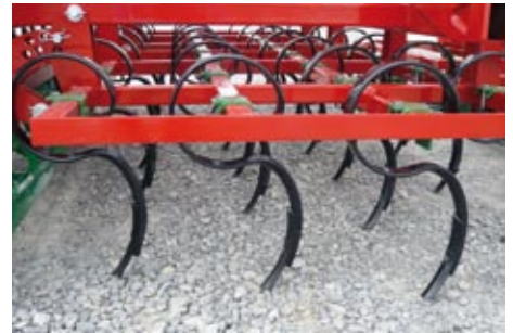
Zinken 45 x 10

Stabile Saatbeetkombination für eine ideale Saatbeetbereitung bei Getreide, Mais, Kartoffeln usw., sowie zur Gülleearbeitung. Lieferbar in den Arbeitsbreiten 4,2 - 5,6 m hydraulisch klappbar. Frontwalze zur Zerkleinerung und Nivellierung des Bodens vor den Eggenfeldern. Zinken 32x10 (Serie), Zinken 45x10 gegen Aufpreis.