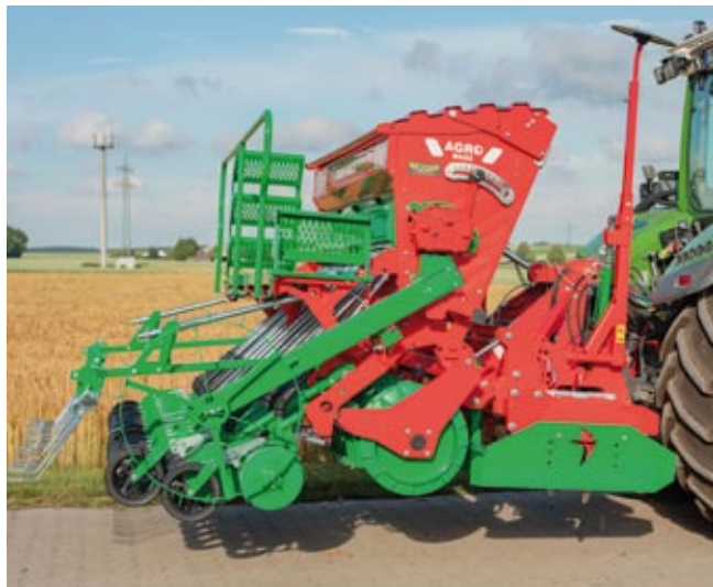
Säkombi SN300A mit Doppelscheibenschar und Kreiselegge