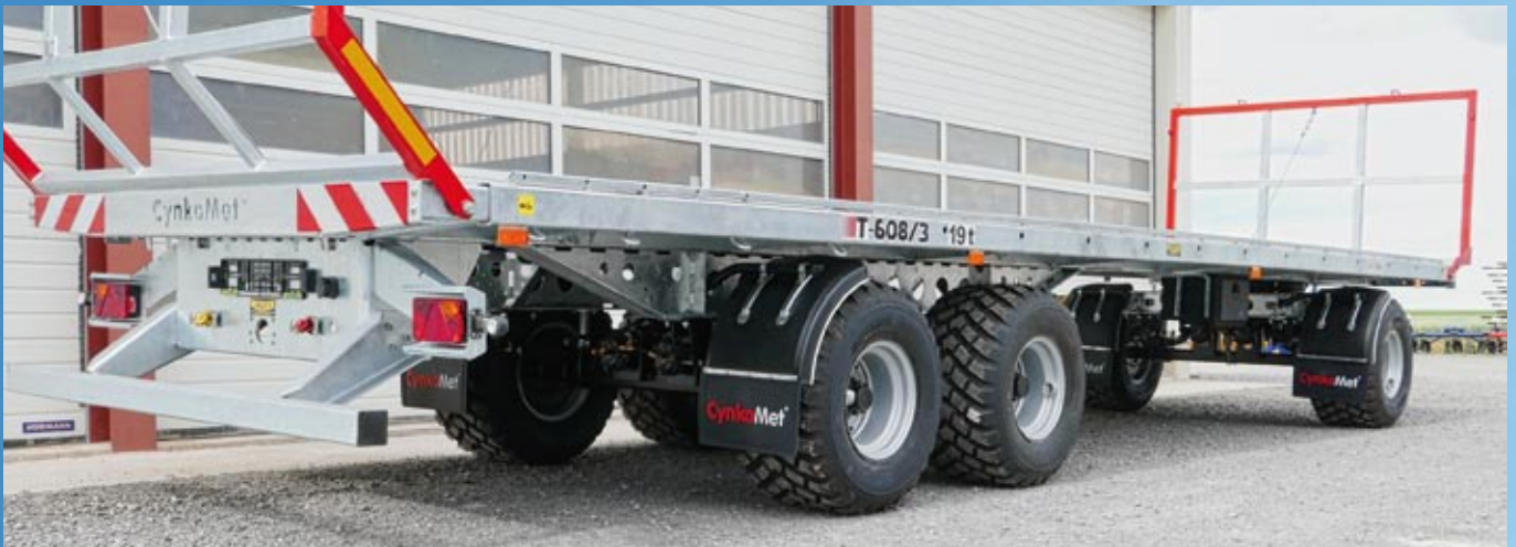
CYNKOMET Ballenwagen 19 t mit Radialbereifung