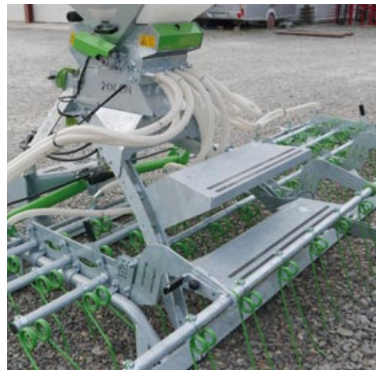
Wiesenstriegel mit 4. Zinkenreihe und Aufstiegstreppe

Dieser Wiesenstriegel vereint die Vorteile von einem normalen Striegel und den günstigen Grünlanddegen. Maulwurfshügel werden sauber eingeebnet und die Grasnarbe gut belüftet. Lieferbar in 6,0 und 8,0 m.