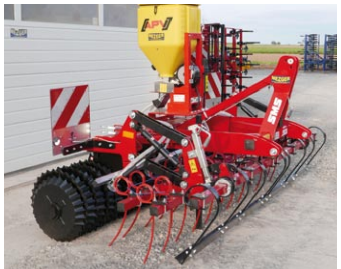
Teran N Gras - mit Planierschiene, Striegel, Sätechnik, Beleuchtung