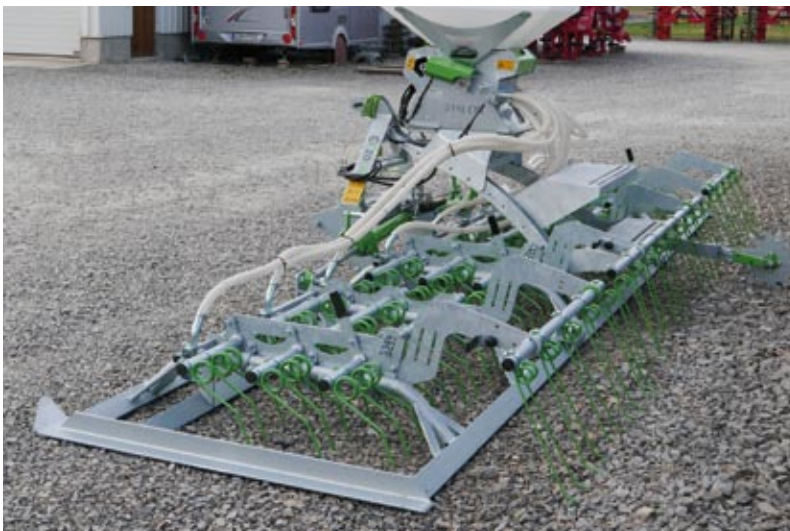
Wiesenstriegel 6,0 m mit Sätechnik