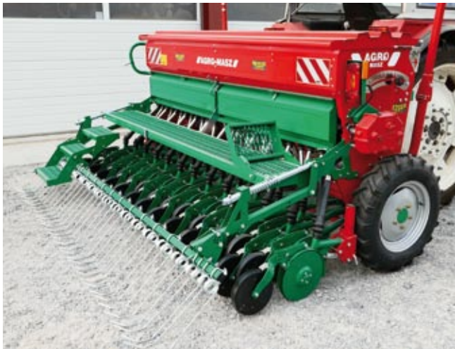
Sämaschine SR mit Doppelscheibenschar