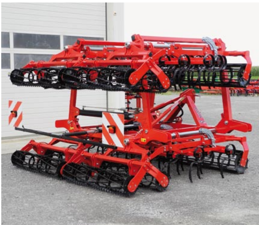
Sigma Plus 6,0 m mit Zinken 45 x 10 und Beleuchtung