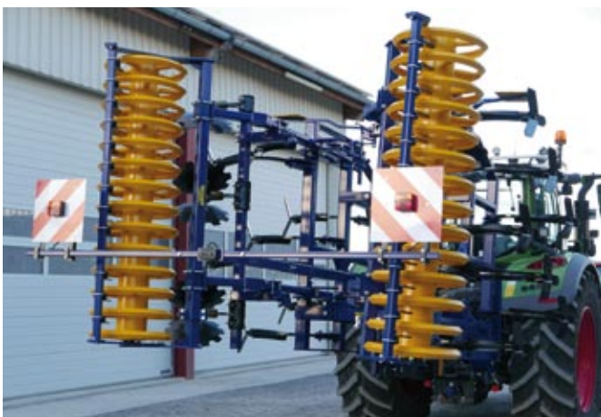
MG 400, 4,0 m mit Dachwalze und Beleuchtung