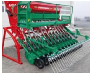
SN 300 mit Abstellstützen

SN: Aufbaudrillmaschine 3 m mit Schlepp- oder Scheibenschar