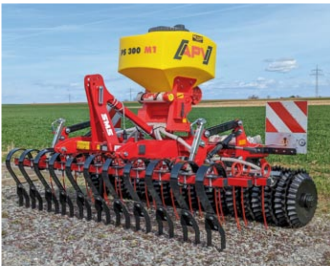
Teran N Gras - mit Doppelmesser, Striegel, Sätechnik, Beleuchtung