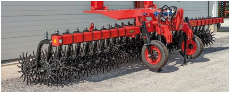
Rollhacke 6,1 m mit Stützrädern, Steinschutzblech und Beleuchtung