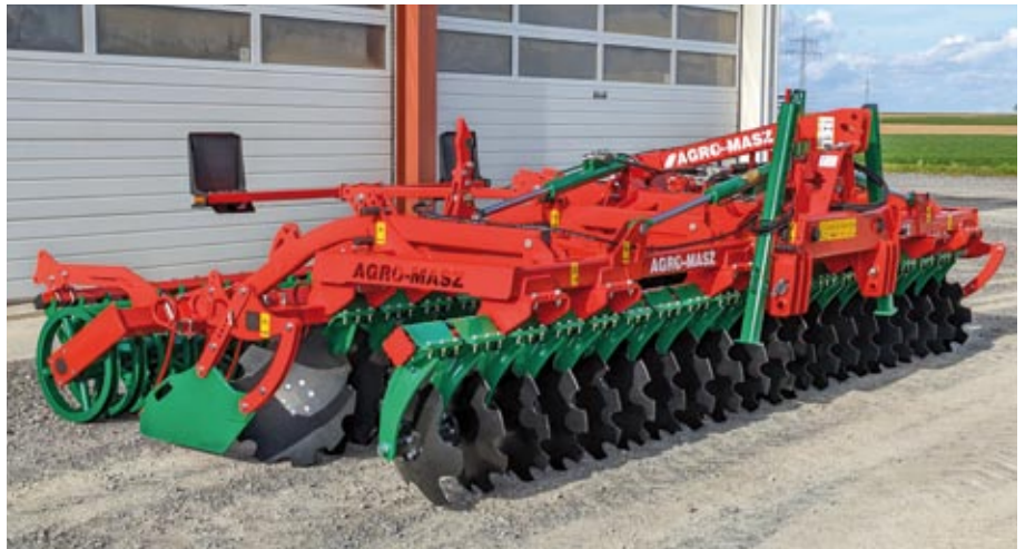
BT 50 (C-Scheiben) mit U-Ringwalze und Striegel