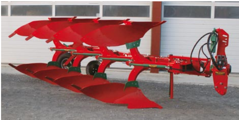
POH - 100 mit XL Körper, hydr. Steinsicherung und Streichblechverlängerung