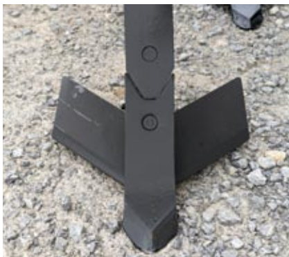
Flügelschar System Köckerling

Durch den großen Balkenabstand ist ein verstopfungsfreies Arbeiten jederzeit gewährleistet.