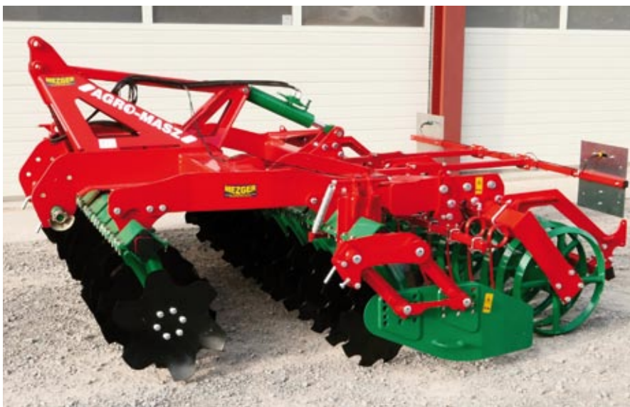
Trol mit Scheiben 560 mm und T-Ringwalze