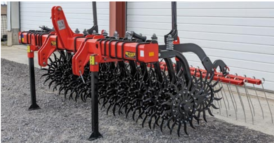
Rollhacke 3 m mit Doppelstriegel

Die Maschine eignet sich hervorragend zum Aufbrechen der Kruste, zur Unkrautregulierung und zur N-Mineralisierung. Breites Einsatzgebiet z.B. Mais, Rüben, Getreide, Bohnen, Erbsen, Sonnenblumen usw.