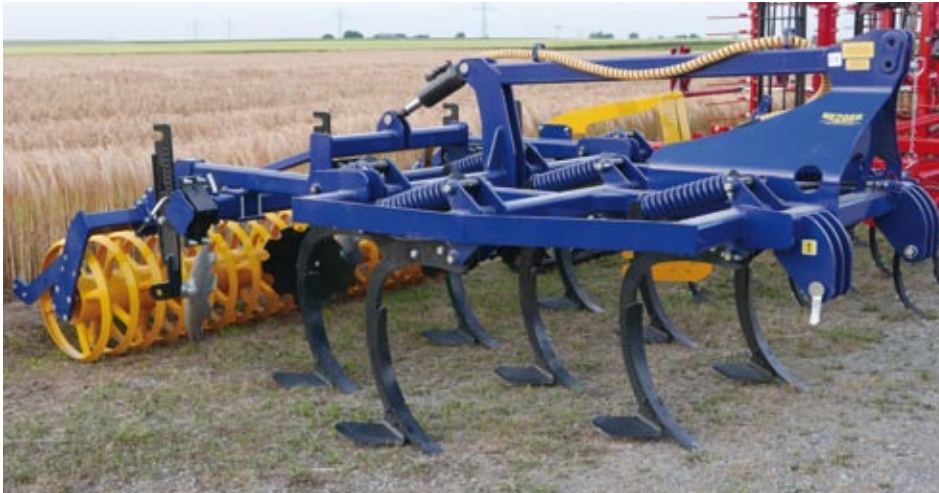
MG 300 gefedert mit Dachwalze (10 Zinken)

3-balkiger Mulchgrubber mit 10 Zinken und hydraulischer Tiefenführung. Intensives Mischen bei flacher oder tiefer Bearbeitung.