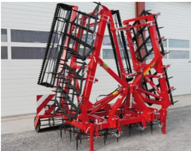
AX 67 mit Stabwalze