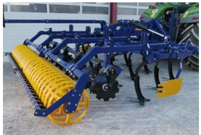
MG 400, 4,0 m, 14 Zinken, Randblech

Ausstattung identisch wie MG 300, ohne hydraulische Tiefenführung.