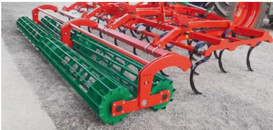
APS 5,0 m mit Schmalscharen, Doppelwalze

Der Agro-Masz APS ist ein günstiger Leichtgrubber für die ganzjährige universelle Bodenbearbeitung. Stoppelbearbeitung, Saatbeetbearbeitung, Einarbeitung von Gülle und auch Unkrautbekämpfung. Alle diese Einsätze sind mit dieser Maschine möglich. Hohe Schlagkraft und geringer Dieselverbrauch zeichnen diese Maschine aus.